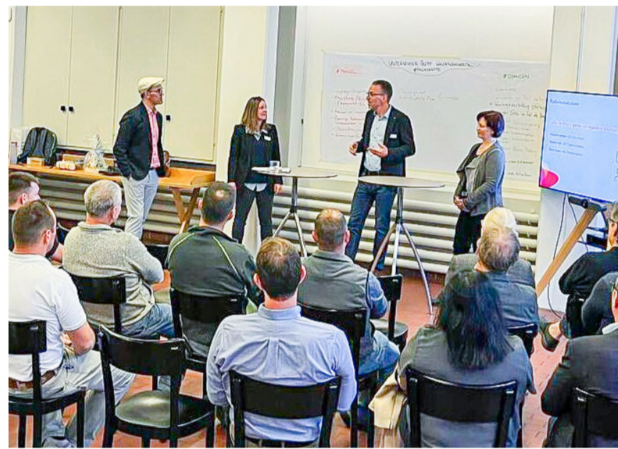
Am Unternehmer-Treff Waldenburger Tal bei der Uhrenherstellerin Oris in Hölstein herrschte reger Austausch.

Das Gritt zeigt, was möglich ist: Trotz einer Branche, die schweizweit zu dem Fachkräftemangel am stärksten betroffenen gehört, verfügt das Seniorencentrum über ein stabiles Team und hat kaum Schwierigkeiten, Stellen und Ausbildungsplätze zu besetzen. Die Gründe liegen in einer Führung, die Verlässlichkeit, Transparenz und Wertschätzung lebt. Verantwortung ist klar verteilt. Kommunikation ist direkt. Die Leitung ist nahbar. Diese Haltung schafft Verbindung und einen Ruf als attraktiver Arbeitgeber – nicht als