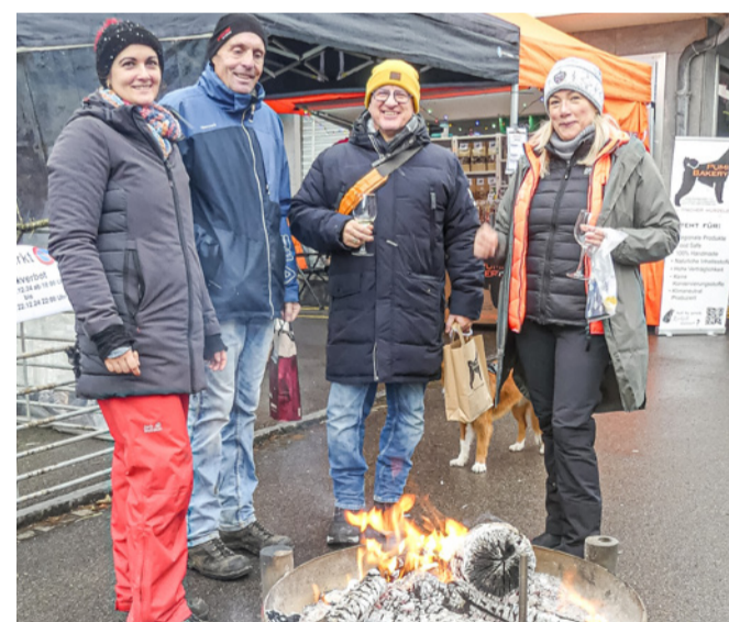
Kalte Finger? Dagegen gibt's Feuerschalen!

Der Weihnachtszauber in Oberdorf am 21. Dezember ist kein normaler Sonntagsverkauf: Statt im