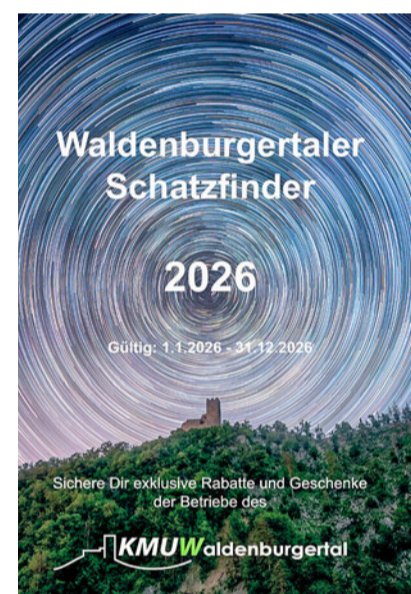
Der Schatzfinder: Wer mit dem WB-Tal verbunden ist, hat einen!